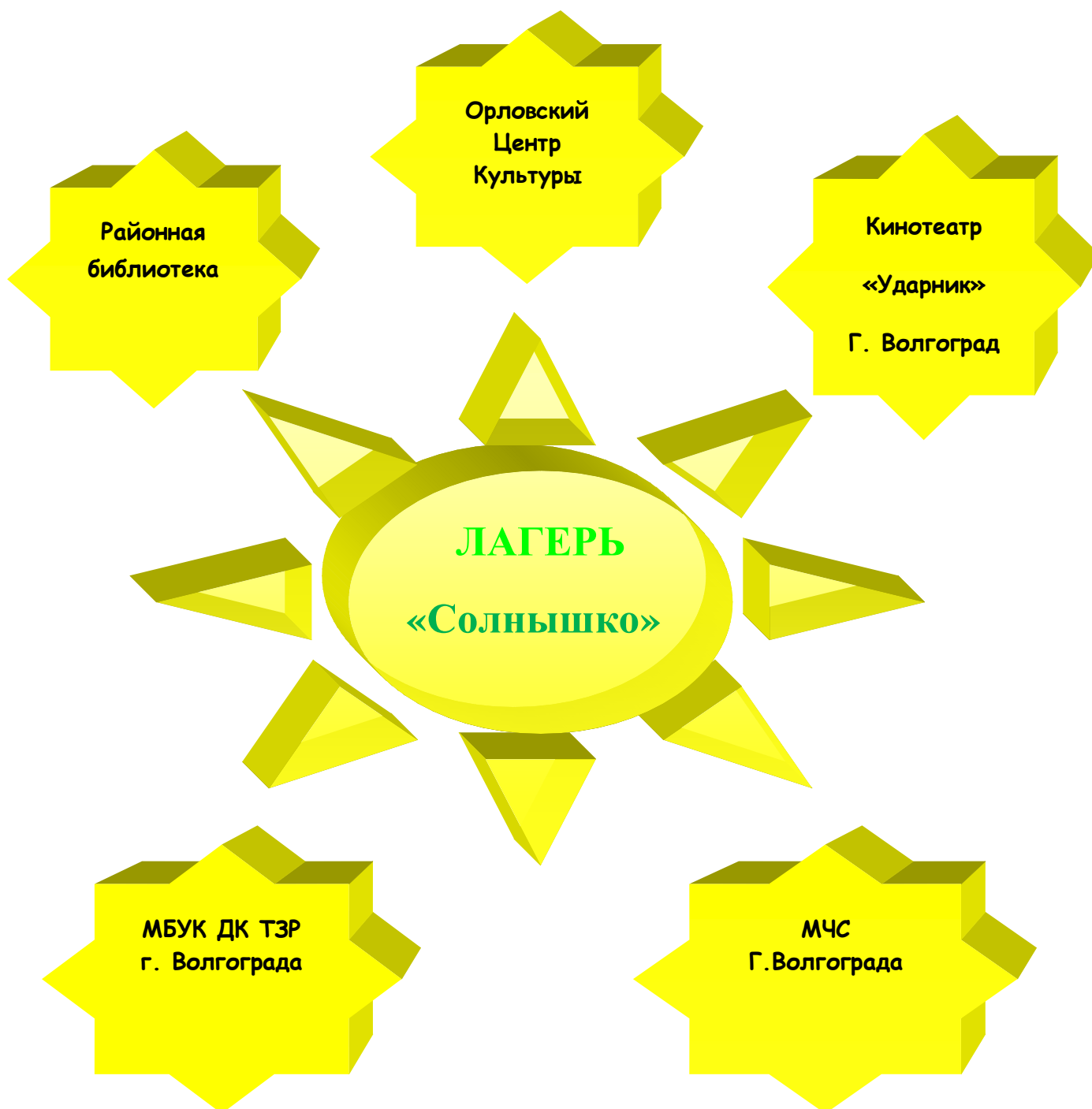
Схема взаимодействия пришкольного лагеря «Солнышко» с социумом в реализации программы