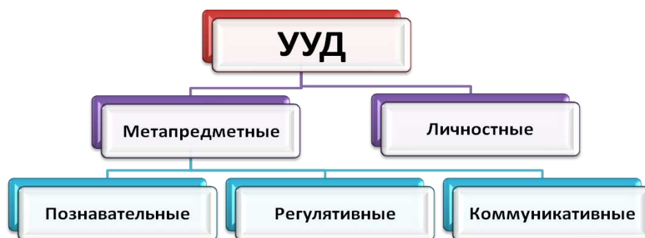
Схема 1. Классификация универсальных учебных действий.

В результате изучения базовых и дополнительных учебных предметов, а также в ходе внеурочной деятельности у выпускников основной школы будут сформированы познавательные, коммуникативные и регулятивные УУД как основа учебного сотрудничества и умения учиться в общении.